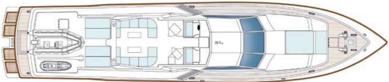
cubierta superior / sun deck